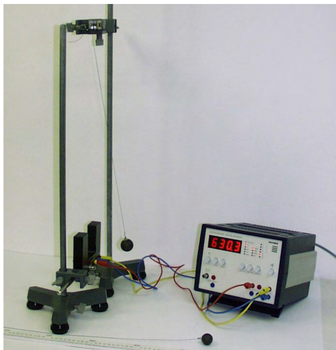
Slika 1. Mjerni uređaj

Uređaj za proučavanje matematičkog njihala prikazan je na slici 1.