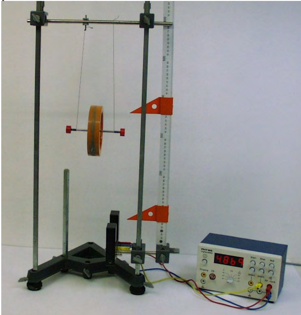
Slika 2. Ekperimentalni uređaj

Ekperimentalni uređaj, prikazan na slici 2, sastoji se od stalka, vodoravna štapa o koji su obješene niti s Maxwellovim diskom, fotoćelije s elektroničkom zapornom urom i mjerne skale na štapu s pokazivačima.