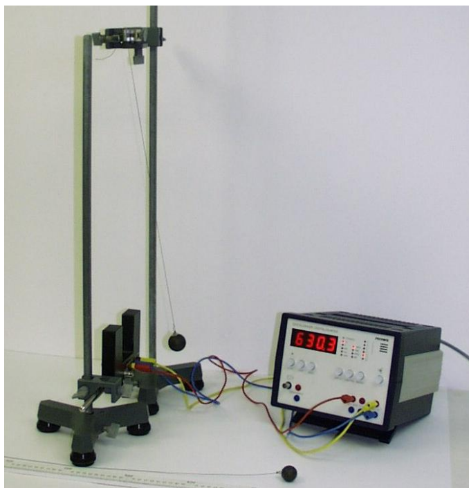
Slika 1. Mjerni uređaj

Uređaj za proučavanje matematičkog njihala prikazan je na slici 1.