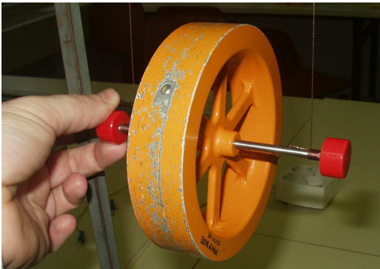
Slika 1. Maxwellov disk. Desno: presjek osovine diska s namotanom niti

Maxwellov disk je disk velikog momenta tromosti, na čiju su osovinu namotane dvije niti obješene na stalak (slika 1).